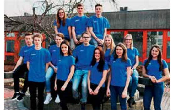
Die Mitglieder des P-Seminars

Nach vielen arbeitsreichen Stunden freut sich das Seminar nun umso mehr, endlich das finale Produkt der Öffentlichkeit präsentieren zu können. Beginn ist am 26. Juli um 20.00 Uhr in der Turnhalle des König-Karlmann-Gymnasiums Altötting. Der Eintritt ist frei, Spenden sind erwünscht.