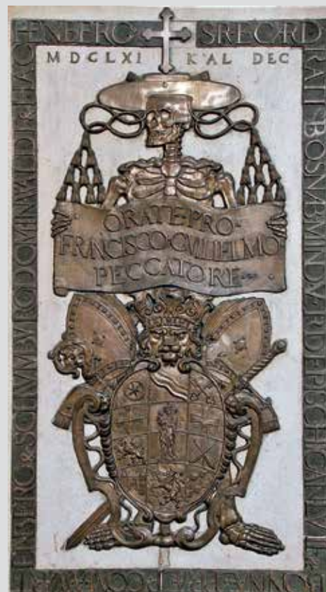
Das Wartenberg Epitaph (Grabdenkmal) in der Stiftspfarrkirche.