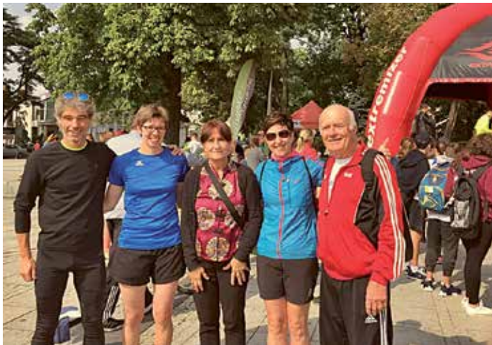
Die Besuchergruppe aus Altötting vor dem Start der „Goldenen Meile“