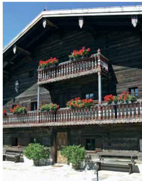
Der Bruder-Konrad-Hof in Parzham.

Bei der Altöttinger Pilgerfahrt begeben wir uns am 4. März 2018 auf die Spuren unseres Altöttinger Pfortenbruders und dritten Diözesanpatrons und steuern die Domstadt Passau an. Neben einer feierlichen Pilgermesse im Passauer Dom stehen natürlich auch eine gemeinsame Mittagspause sowie ein ansprechendes Besichtigungsprogramm in der Innenstadt auf dem Plan. Als würdiger Tagesabschluss bildet dann die Schlussandacht am Geburtsort des Hl. Bruder Konrads, in Parzham den Höhepunkt des Tages. Auch für einen Rundgang durch das Geburtshaus des Hl. Bruder Konrads und das angeschlossene Museum bleibt ausreichend Zeit. Speziell für die Kommunionkinder und Familien wird es wieder ein eigenes kindgerechtes Programm und einen eigenen Familienbus geben. Die organisatorische Leitung der Pilgerfahrt übernimmt traditionsgemäß das Altöttinger Wallfahrts- und Verkehrsbüro, die geistliche Leitung unterliegt Wallfahrtsrektor und Stadtpfarrer Prälat Günther Mandl. Detailliertes Programm und Anmeldung gibt es ab Februar im Wallfahrts- und Verkehrsbüro.