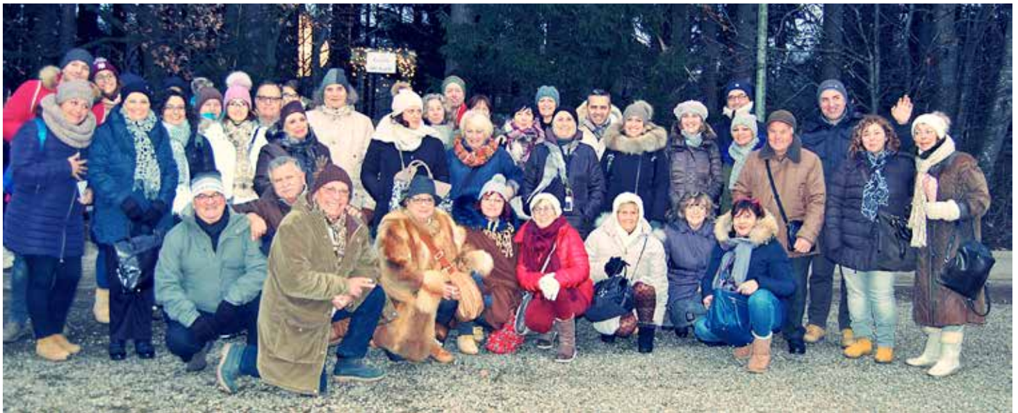
Die italienischen Besucher voller Vorfreude auf dem Halsbacher Waldmarkt, den sie „la magia del Natale un bosco favoloso“ (Die Magie von Weihnachten in einem sagenhaften Wald) nennen.