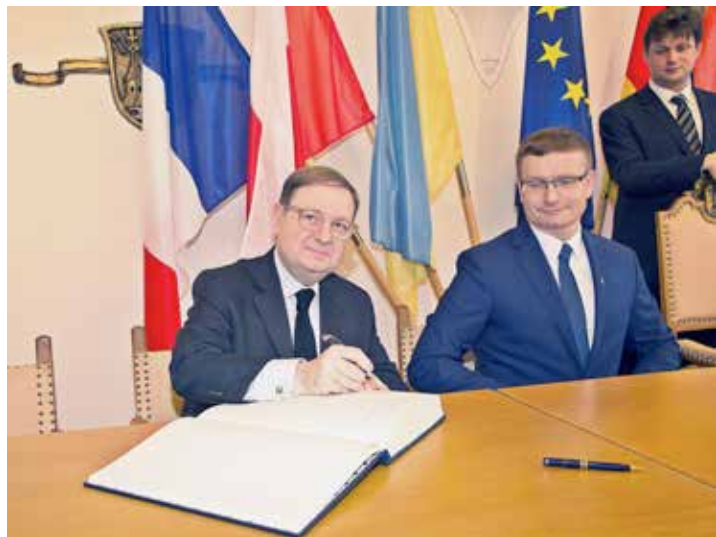
Foto: Eintrag in das Goldene Buch