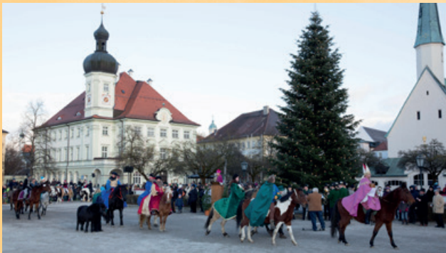
Stephani-Umritt am Kapellplatz